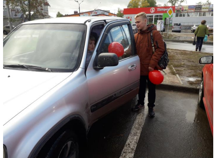
Совет ДОО «Феникс»

Совет ДОО «Феникс» выражает благодарность учащимся 9а класса за организацию и проведение акции.